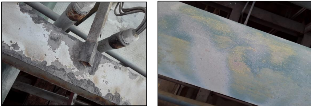
Superficies tratadas con Chorro abrasivo al grado SSPC-SP7

La adherencia del óxido, productos de corrosión, y pintura fuertemente adherida remanente en la superficie no es posible determinar en toda la extensión del proceso.