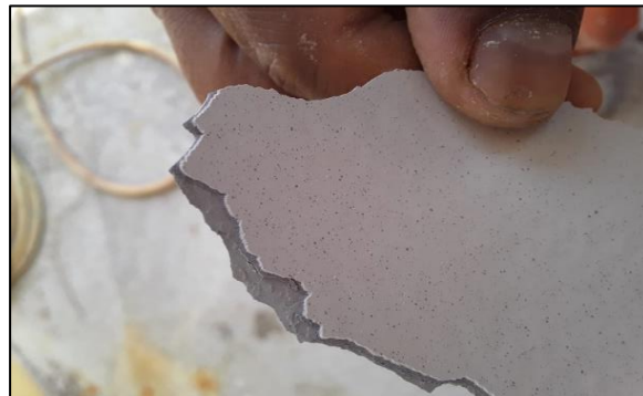
Desprendimiento de capas de pintura por alto espesor

En muchas plantas industriales no se registran los procesos de mantenimiento con recubrimientos y no se tienen un plan de inspección localizado mediante zonas de monitoreo por control. Por consiguiente, la aplicación de capas sucesivas de pintura llega a tener espesores superiores a los 40 mils. El sistema tiende a fragilizarse por el alto espesor y peso sobre la película de pintura adherida directamente al sustrato o ent la capa más débil.