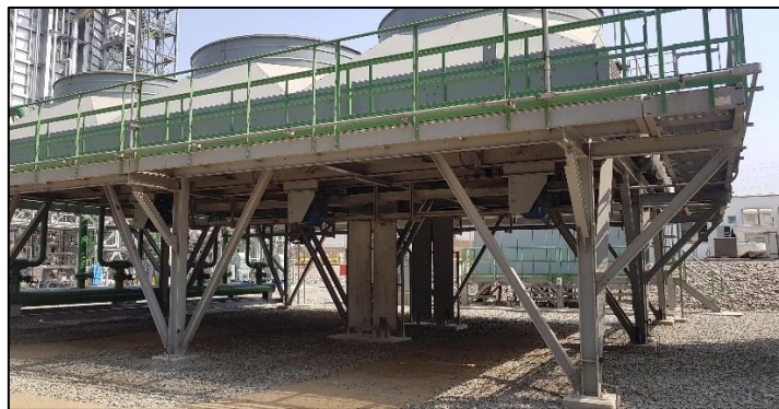
Seleccionar un mínimo de 3 zonas de prueba en un complejo industrial

El método de aplicación debe ser similar al que se va a realizar durante la ejecución del mantenimiento. Las condiciones ambientales deben ser monitoreadas antes, durante y después de la evaluación.